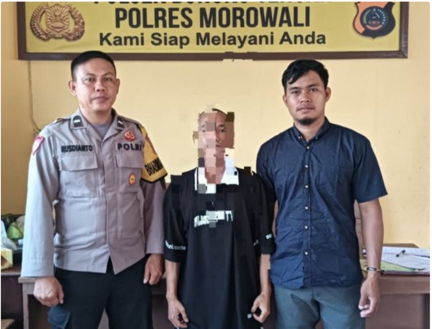
Aparat Polsek Bungku Tengah Berhasil Tangkap Pelaku Curanmor

MOROWALI, Sulawesi Tengah- Pada Hari Sabtu 5 Oktober 2024 Sekitar Pukul 18.30 Wita Kepolisian Sektor (Polsek) Bungku Tengah Polres Morowali, berhasil